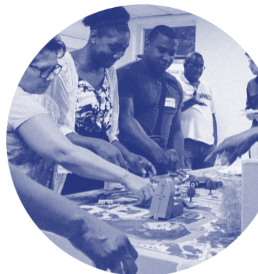
Afbeelding 1: CLT Bijlmer

Afgelopen decennium is het woord 'precariaat' opgekomen, om een groeiende groep mensen in de maatschappij te duiden die te maken hebben met onzekerheid op sociaal, economisch, cultureel en politiek vlak, met als gevolg toenemende polarisatie, populisme en een afkeer van instituties. In de afgelopen 10 jaar zagen we stijgende woonlasten, oplopende wachttijden, groeiende ongelijkheid en gentrificatie, maar ook weerstand bij nieuwe ontwikkelingen en teruglopende opkomst bij gemeenteraadsverkiezingen, vooral in wijken waar sociale problematiek heerst. Participatie moet het toverwoord zijn, maar wordt niet gedragen door bewoners, die het participeren staken, omdat ze zich niet echt gehoord voelen. Er liggen sterke behoeftes in buurten, evenals niet onderkende en onzichtbare krachten en waarden, democratische doelstellingen bij gemeenten, sociale doelstellingen bij woningbouw en ontwikkelaars, een enorme bouwopgave in het land en een ecologische uitdaging voor de planeet, maar we slagen er niet in om dit met elkaar te rijmen. Kind van de rekening zijn mensen en gemeenschappen in wijken met beperkte middelen en invloed, maar met duidelijke behoeftes, ideeën, idealen, kansen en talenten.