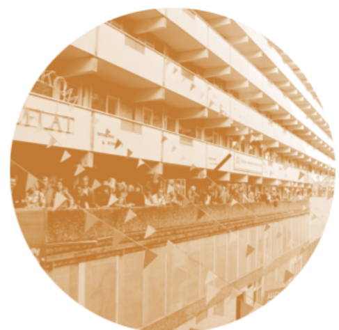
Afbeelding 5: CLT Bijmer