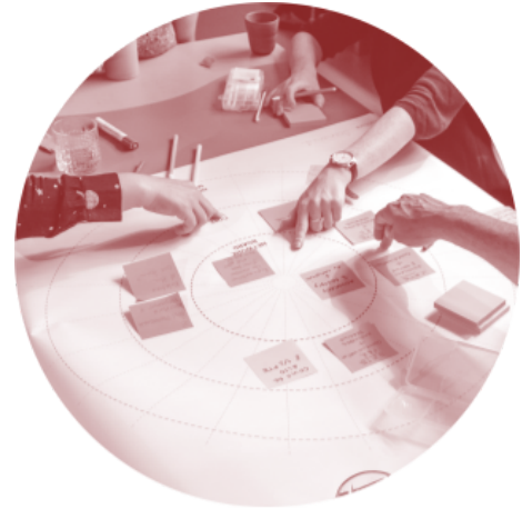
Afbeelding 3: European CLT network in Amsterdam

Een Community Land Trust betreft bewoners, gebruikers, ondernemers, buurtgenoten en lokale overheden bij het eigenaarschap en zeggenschap over land. Samen vormen ze een Community van mensen die samen ontwikkelen, samen leven en samen faciliteiten delen en beheren. Het Land wordt onttrokken uit de markt en komt in gedeeld eigenaarschap van de gemeenschap, waardoor de prijs van vastgoed niet meer wordt beïnvloed door stijgende grondprijzen en dus eerlijk en toegankelijk kan blijven. De Trust zorgt voor gedeeld beheer van het land en haar bebouwing, en garandeert betaalbaarheid en duurzaamheid voor de komende generaties. Duurzame ontwerp-, bouw- en beheerkeuzes worden in de hand gewerkt doordat een Community Land Trust anti-speculatief is en zich richt op de lange termijn en de belangen van de community, waarin lokale en publieke belangen verenigd worden.