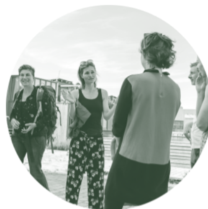
Afbeelding 2: European CLT network in Amsterdam

Een gemeenschap die zich geen zorgen hoeft te maken over de toekomstige betaalbaarheid van woningen en overig vastgoed, maar zich juist kan bekommeren over de toekomstige leefbaarheid ervan. Een plek dat door een transparante en overzichtelijke juridische structuur rechtvaardig en democratisch wordt ingericht naar de gedeelde sociale en ecologische waarden van de gemeenschap. Woningen, winkels, en maatschappelijk vastgoed zoals kinderdagverblijven, sportscholen, of buurthuizen worden ontwikkeld, beheerd en aangepast naar de wensen van de gemeenschap. Het commerciële vastgoed wordt zodanig beheerd en verhuurd dat basisvoorzieningen blijven bestaan, dat het werk- en leerplekken creëert voor mensen uit de buurt, en dat opbrengsten weer worden geïnvesteerd in de buurt zelf. Doordat mensen onderling verbonden zijn én er een goed georganiseerde vereniging is, is er een hoge mate van vrijwilligerswerk en bijdragen door buurtbewoners zelf, bijvoorbeeld rond het groenonderhoud, de buurtmoestuin en ouderenzorg.